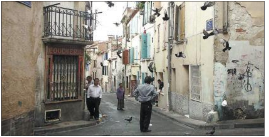
Barri gitano de Perpinyà (França). / PERE DURAN

Quan un festival com el World Voices o un congrés o un simposi qualsevol tenen lloc en una gran ciutat plena de temptacions de tota mena, aquesta ciutat no para mai de cridar-te. Sí, Nova York era allà fora i em cridava. Feia deu anys que no hi havia estat i tenia ganes de retrobar-la, de veure com havia canviat. La veritat és que la vaig trobar més vella i més bruta. Havien passat moltes coses, és clar. Havien caigut les torres bessones i ara la crisi planava amb un pes inesperat sobre la vella ferida. Obres, carrers aixecats, fum, i un trànsit confús, sorollós i intens. Tot el que fa deu anys em va semblar joventut i tensió ara ho veia marcat per les xacres de l'edat. Les autopistes d'accés a Manhattan des de Newark, el cinturó que volta la part alta de l'illa, els ponts, em mostraven el seu formigó fatigat i els seus ferros repintats innumerables vegades. Aquell esclat elèctric com de música de Gershwin que em va