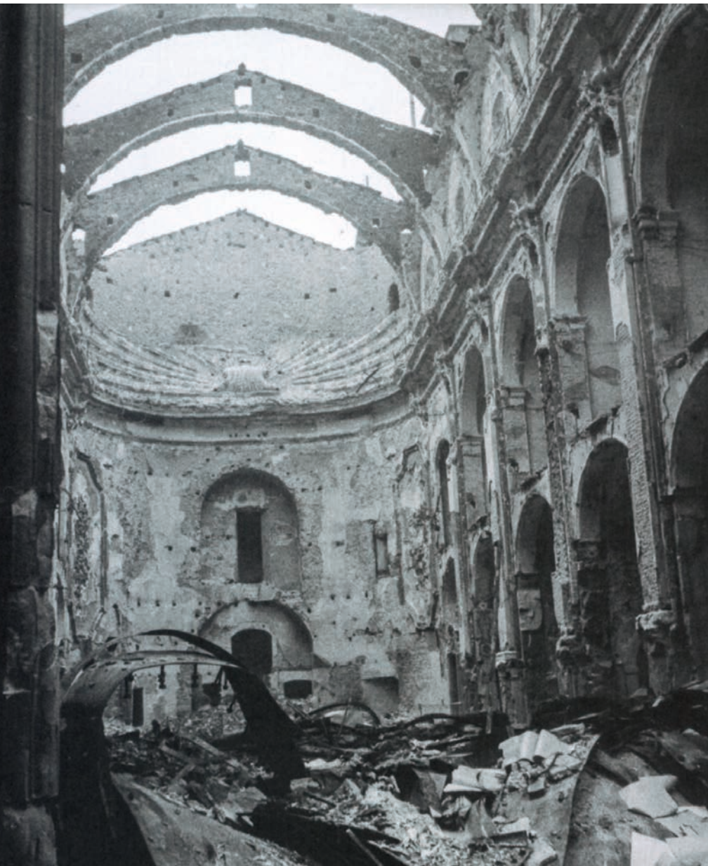
L'església de Betlem, ubicada a la Rambla cantonada amb el carrer del Carme, després de ser incendiada el juliol de 1936. Reventós hi veia un símbol de la força destructora de la revolució a Barcelona.

Aquest dietari, com el text d'Amadeu Hurtado de reflexió Abans del sis d'octubre [Quaderns Crema, 2008], són fites incòmodes però necessàries per a la reflexió política del passat, del present i del futur. ■