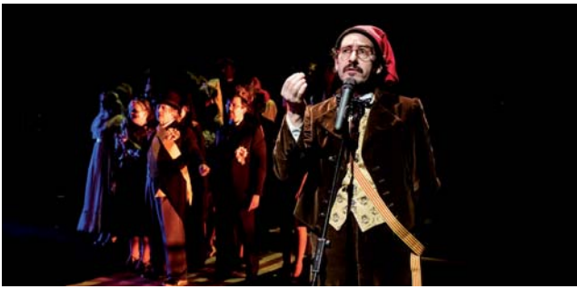
Els Jocs Florals de Canprosa.

prosa hagué de ser protegida perquè els Jocs Florals de Barcelona havien estat suspesos el mateix 1902 arran d'una xiulada que s'havia produït a la bandera espanyola; l'obra i Rusiñol s'havien convertit en cap de turc del catalanisme benpensant. I amb El místic i El bon policia es veié obligat a modificar-ne certs passatges perquè no acabés igual que L'Hèroe .