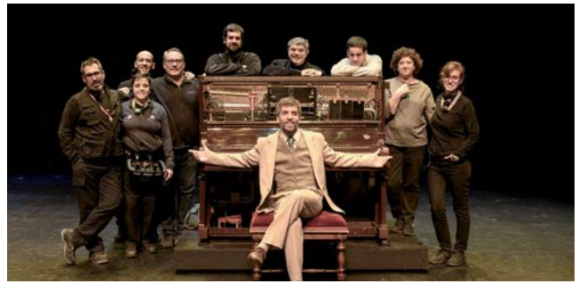
La 'niña' gorda.

Dèiem que Rusiñol bregava amb la contemporaneïtat. El decés de Jacint Verdaguer s'havia produït el 1902, i l'any següent Enric Borràs ja feia de mossèn Ramon, transsumpte de mossèn Cinto, en El Místic . Més que ser un drama polèmic, ho era, en aquest cas, tot el context d' En defensa pròpia i el «calvari» patit pel sacerdot de Folgueroles. És una obra clarament inspirada en aquesta tragèdia personal. D'esperit clarament franciscà i un punt càndid, de seguida es veu que el protagonista és un místic que no combrega ni amb l'Església ni amb el bisbe que fa d'àlter ego del bisbe Morgades. Hem