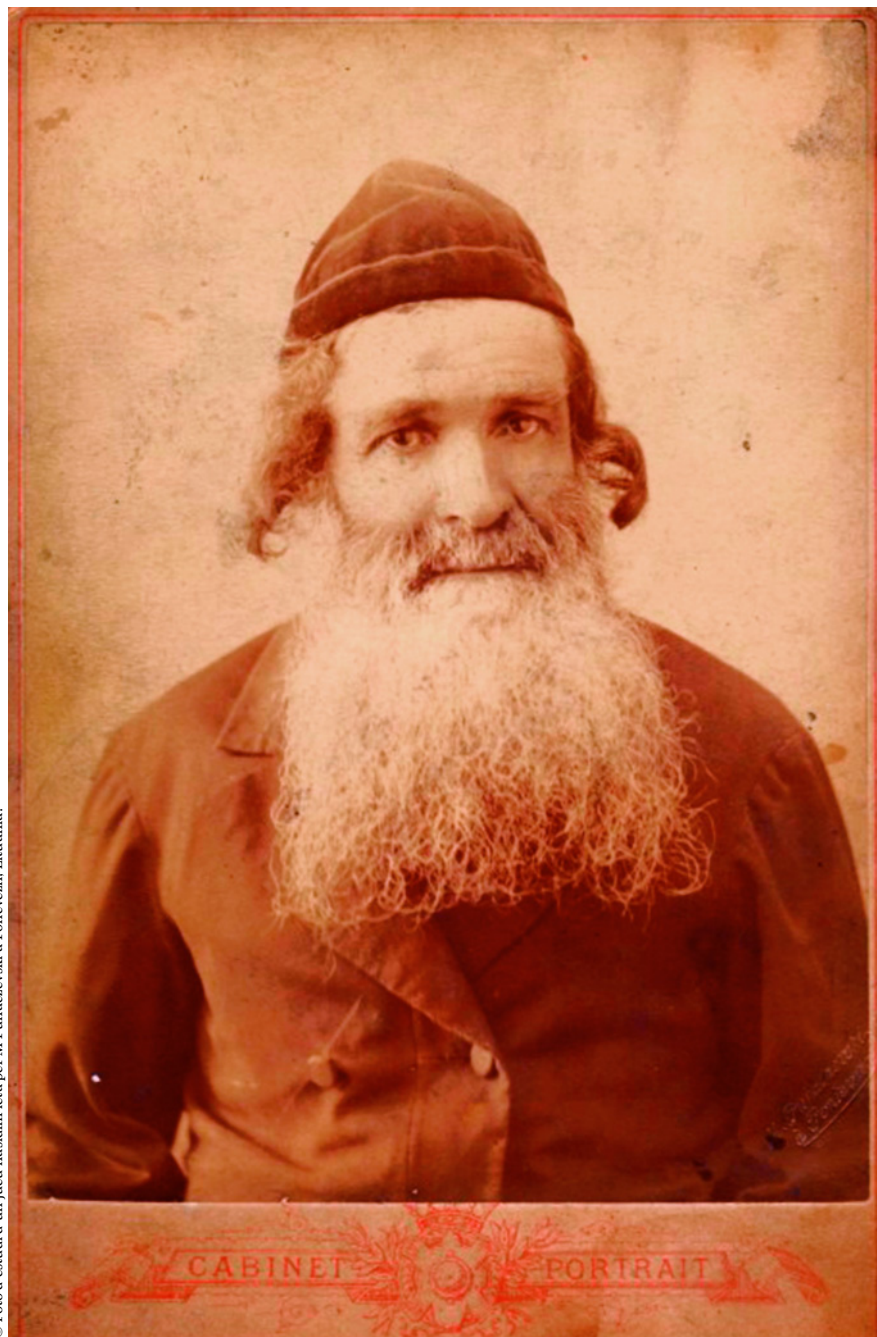
© Foto d'estudi d'un jueu hasidim feta per M. Puhaczewski a Ponevezh, Lituània.

La novel·la sobre Mendel Singer exclou de la realitat que descriu precisament el factor clau. L'autor escriu en alemany, però no avalua la pressió demolidora d'una cultura sota la qual s'inscriu voluntàriament. És més encara, el marc administratiu és representat només pels funcionaris i soldats russos, com si Àustria no pogués quedar tacada pel tribut que es van cobrar en la Gran Guerra les trinxeres de Galítsia ni per l'entusiasme que la població alemanya del desaparegut Imperi mostrava envers el nazisme. Els alemanys no hi són i els goyim –és a dir els no jueus– són anomenats simplement «pagesos». Tan podrien ser rutens com ucraïnesos (dos noms per a un mateix poble), polonesos, txecs, eslovacs, serbis o croats (tots aquests habitualment resumits com a «eslaus») o bé romanesos, hongaresos –i també, per què no, holandesos, italians o grecs... La massacre de Babij Jar –en només dos dies de setembre de 1941, el Sonderkommando de Kíev va afusellar més de 30.000 jueus i va amagar els cossos en aquest pre-