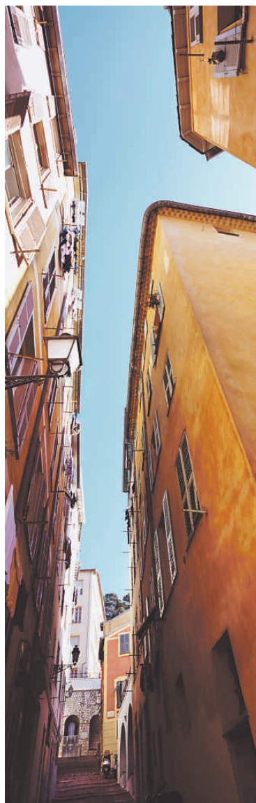
Contrapicat d'un carrer de Niça

Per les pàgines de Les meues universitats hi desfilen una gran quantitat de personatges pintorescos, de noies maques que duen el narrador pel camí de l'amargura, de professors carregats de punyetes que deixen en el Bezsonoff jove una sensació de desencís, perquè tot el que prometia de bo l'escola acaba