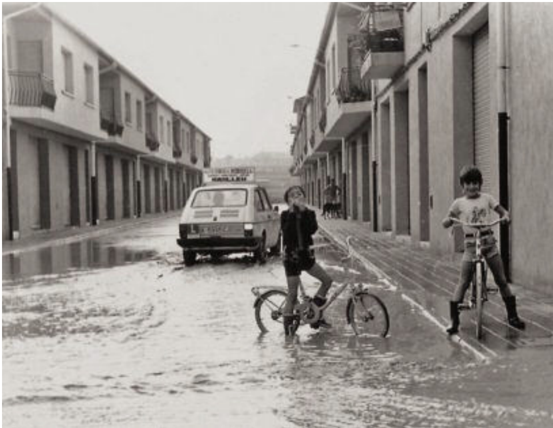
Aiguat del juliol de 1979, en un dels barris de Manlleu.