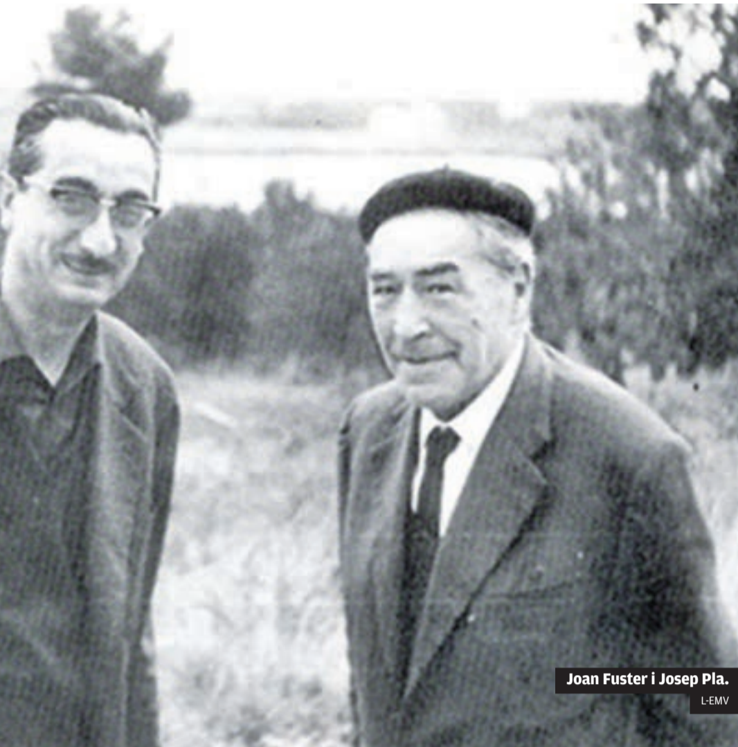
Joan Fuster i Josep Pla.