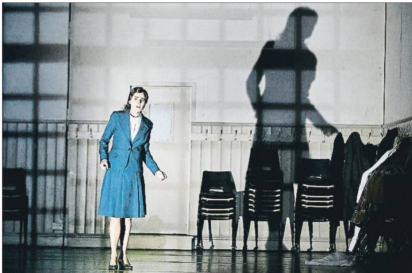
GRAN TEATRE DEL LICEU