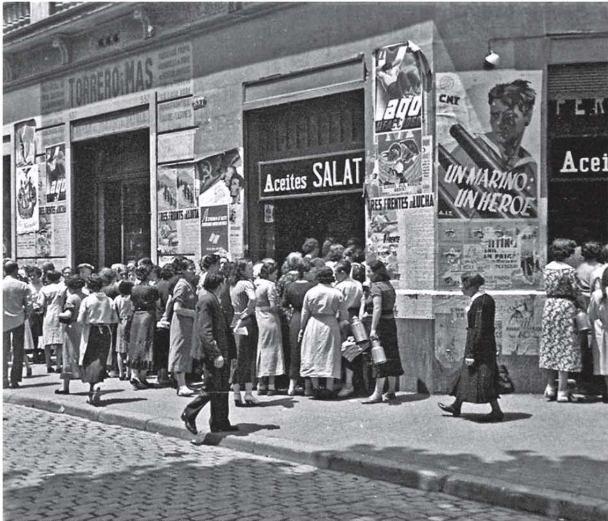
Cues per demanar oli i altres aliments bàsics a Barcelona durant la Guerra Civil.