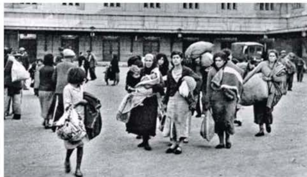
Augmentava la població de Barcelona (refugiats de Màlaga a l'Estació de França el 1937) i mancaven aliments, que obligaven a campanyes institucionals com la dels ous (a sota).

Si bé és cert que els Fets de Maig van significar un debilitament de la Generalitat, el trasllat del govern de la República a Barcelona va accelerar decididament aquesta tendència. El desfavorable curs militar de la guerra va ser l'altre ingredient necessari per afegir arguments a un reforçament del govern de la República que només es podia produir a costa d'empèitir la Generalitat. D'aquesta manera, mesures que inicialment eren provisionals —com el control per part de la República dels serveis d'ordre públic— es van convertir en definitius quan Juan