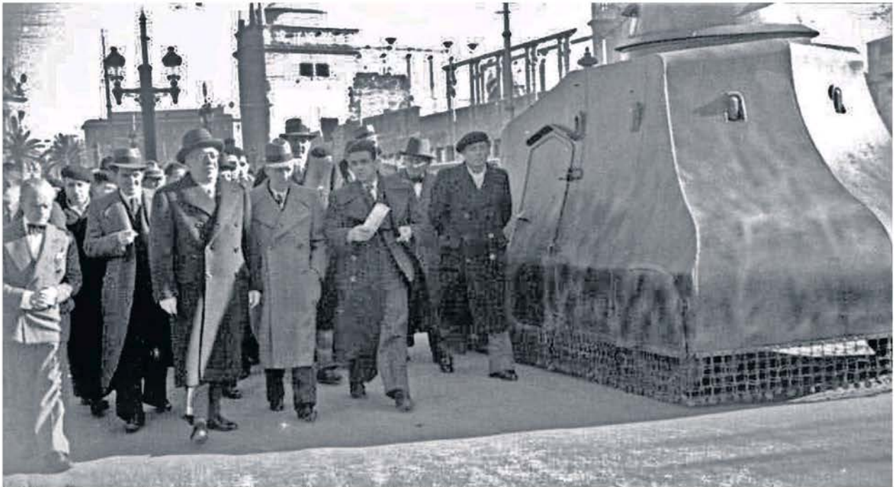
Azaña i Companys passen pel costat d'un tanc blindat construït a Catalunya per les Indústries de Guerra.