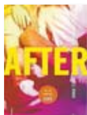
After ANNA TODD TRAD. ESTHER ROIG Columna

Quan sembla que tot va bé, un viatge casual a l'Empordà per recollir l'herència d'un familiar a qui no coneixen canviarà per sempre la vida de la Gala i les seves dues filles. Les mentides i els secrets familiars surten a la llum, i s'enfronten a la veritat enterrada, l'única capaç d'ajudar-les a tancar per sempre les ferides del passat. La periodista Sandra Barneda presenta La terra de les dones , el seu segon llibre després que publicés Reír al viento l'any 2013.