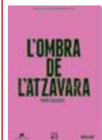
L'OMBRA DE L'ATZAVARA PERE CALDERS EDICIONS 62 288 PÀG./9,95 € (AQUEST DIUMENGE, AMBLARA)

El desenllaç de la Guerra Civil obligaria a ajornar les trajectòries de tots quatre autors. Espriu gairebé va abandonar la prosa, fins que va reneixer com a poeta amb Cementiri de Sinera (1946). Francesc Trabal es va instal·lar a Xile i no va publicar res fins a Temperatura (1947). Rodoreda va viure a París i a Ginebra, des d'on va escriure Vint-i-dos contes (1958) i La planta del Diamant (1962). I Calders, durant l'estada a Mèxic (1939-1962) va treballar alguns dels seus grans llibres, des de Cròniques de la veritat oculta (1955) fins a L'ombra de l'atzavara , que va publicar a Selecta al 1964, quan ja havia tornat a Barcelona. ♦♦