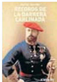
RECORDS DE LA DARRERA CARLINADA MARIAN VAYREDA L'AVENÇ 136 PÀG./13 €

És veritat que Vayreda no explota tot el potencial narratiu d'algunes escenes, que en ocasions el relat és estàtic i li costa ser trepidant i que a vegades automatitza el recurs del contrast entre la innocència del jove i el desencany de l'adult. Però l'ús viu que s'hi fa del llenguatge, la perspicàcia d'home desencantat del narrador i el colorisme autèntic amb què hi bateja el passat fan de Records de la darrera carlinada un llibre tan amè com interessant. ♦♦