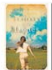
La terra de les dones SANDRA BARNEDA Rosa dels Vents

Quan sembla que tot va bé, un viatge casual a l'Empordà per recollir l'herència d'un familiar a qui no coneixen canviarà per sempre la vida de la Gala i les seves dues filles. Les mentides i els secrets familiars surten a la llum, i s'enfronten a la veritat enterrada, l'única capaç d'ajudar-les a tancar per sempre les ferides del passat. La periodista Sandra Barneda presenta La terra de les dones , el seu segon llibre després que publicés Reír al viento l'any 2013.