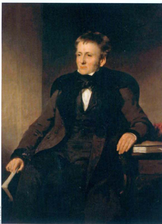
Thomas de Quincey.

L'obra s'inicia amb una devota biografia del filòsof, seguida de la narració –ficció– de com el va conèixer, dels hàbits de Kant –educats però obsessivament rituals– i de la confiança amb què el filòsof el distingí. Després s'inicia la relació de les “xacres de l'edat que començaren a apoderar-se de Kant”: la falta de memòria, “la feblesa amb què començà a teoritzar”, la pèrdua del sentit del temps i, en general, “la seva imbecil·litat”. Kant perd, progressivament, el control sobre si mateix i acaba confessant “cauré com un pilot de draps vells”. “Ja n'hi ha prou van ser les seves últimes paraules”. I el lector gairebé ho agraeix. Memorable.