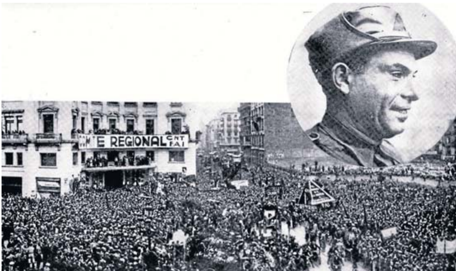
L'enterrament de Buenaventura Durruti, un dels anarquistes més coneguts, va ser multitudinari. En aquesta imatge, captada a la Via Laietana, es pot veure el local de la casa Cambó, expropiat per la CNT-FAI. L'AVENÇ